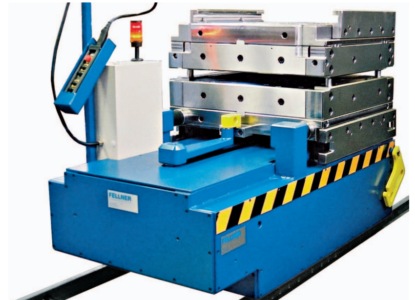
Kassetten-Wechselwagen mit wechselbereiter Rechteckgesenkkassette (Ansicht von hinten-rechts)