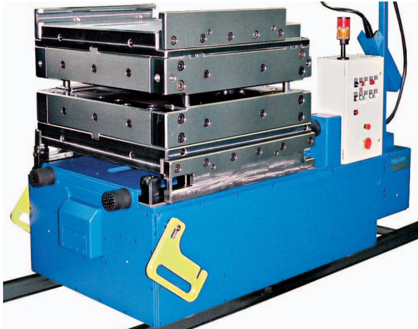
Kassetten-Wechselwagen mit wechselbereiter Rechteckgesenkkassette (Ansicht von vorne-links)